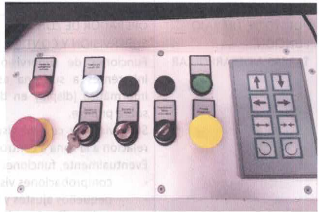
Botonera de control sobre el pupitre