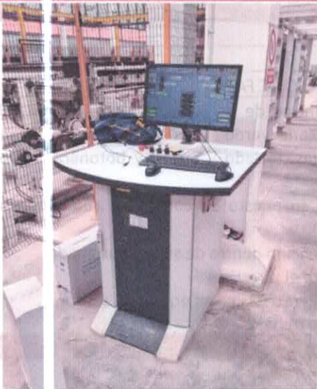
Puesto de control