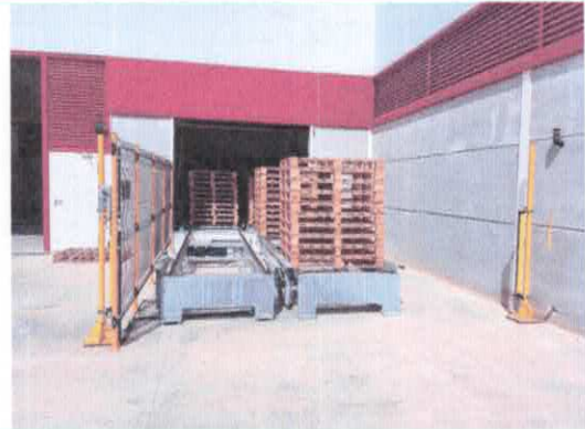
Zona de carga de palés vacíos