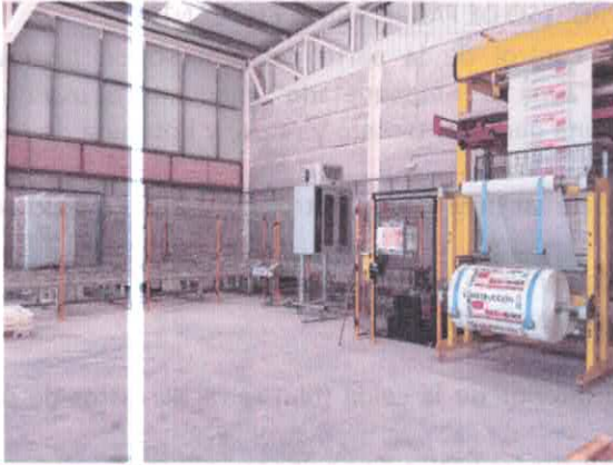
Zona de empaquetado