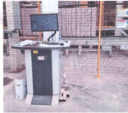
Pupitre y puesto de control