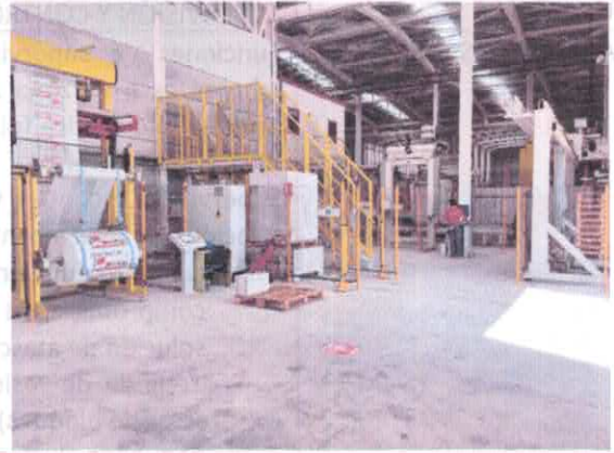
Zona de empaquetado