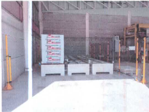
Zona de descarga de palés terminados